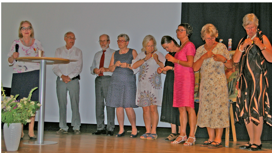
Några av jubelstudenterna.

68-orna. Glädjande nog fanns även en grupp ”unga” studenter från 1970-talet närvarande. Att en studentexamen från Växjö som grund har gett möjligheter till arbete och vuxenliv i hela landet och utomlands kan vi se av de utspridda hemortsadresser som dagens återvändare uppvisar.