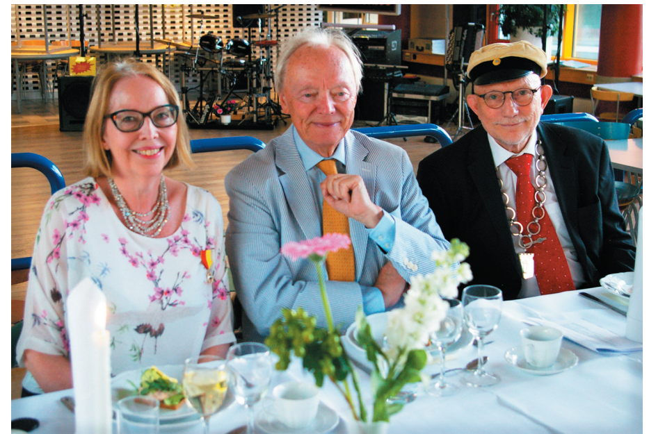
Curator, Inspector och Rector Diei.

Blott boken kom fram, när det började kvällas Kring leriga vägar och höstvåta fält, Så stod där ett marmorskimrande Hellas Och lyste kring landet av gråsten och svält De bildade efter så gott de förmådde I rödfärgad furu arkader och fris. Och ande och eld var säden de sådde i höstarnas gråkalla dis. Han skyndar förbi, och böckerna glida Nervöst under armen, och rockskörtet slår. Men tigande skrider ett tåg vid hans sida Av torftiga hjältar ur slocknade år. Du ser hans maskinknutna slips och hans vända Och trådslitna rock. Är det allt vad du ser ? Du känner ej honom. Hans namn är kanhända Linneus eller Tegnér.