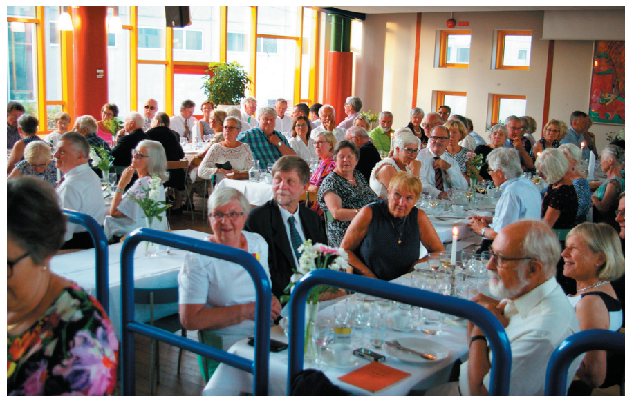
Den andra hälften av middagsborden.