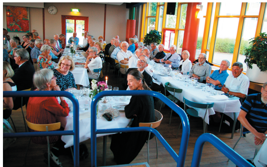
Ungefär hälften av deltagarna i middagen.