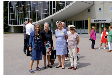
VSF kommitté på skolgården.