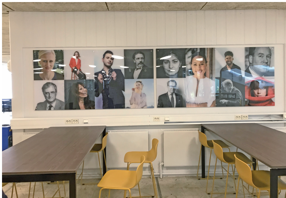
Kända svenskar som tagit studenten på Katedralskolan genom åren kan ses i elevhallen.