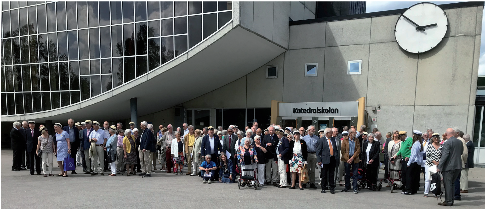
Samling på skolgården innan vi bänkar oss i aulan.