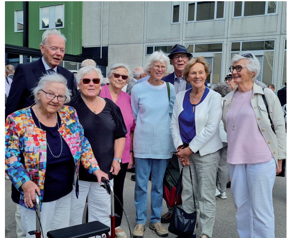
1957 års jubilarer samlade på skolgården