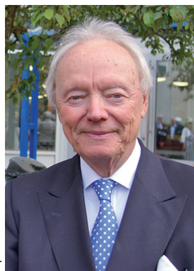
kedjan som RD år 2006.